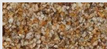
MAR2 G04 HBW 19