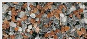
MAR2 M059 HBW 21