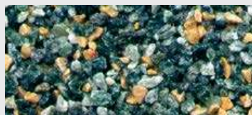
MAR2 M104 HBW 14