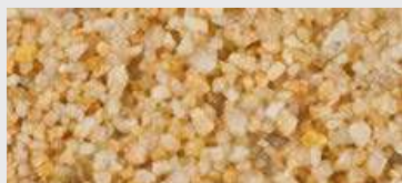
MAR2 G06 HBW 35,5