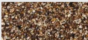
MAR1 G02 HBW 12,5