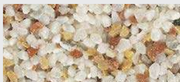
MAR2 M051 HBW 36