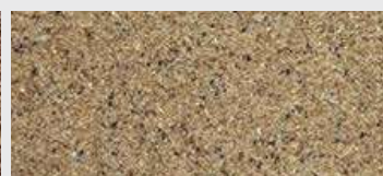
DE ST 04