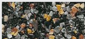
MAR2 M053 HBW 11