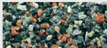
MAR2 M102 HBW 13