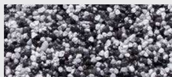
DE SA OOKC