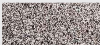
DE ST 10