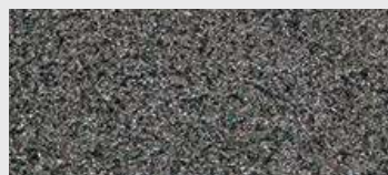
DE ST 07