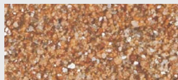
MAR1 G01 HBW 24