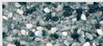
MAR2 M101 HBW 13