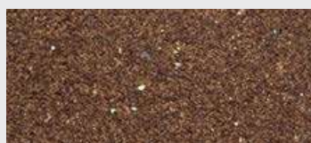
DE ST 02