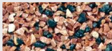
MAR2 M105 HBW 13

Pro lepší představu skutečné barevnosti navštivte stavebniny a vyžádejte si vzorník.