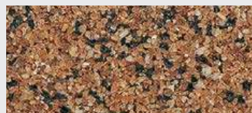
MAR1 M074 HBW 17