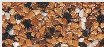
MAR2 M058 HBW 16