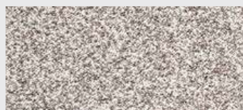
DE ST 11