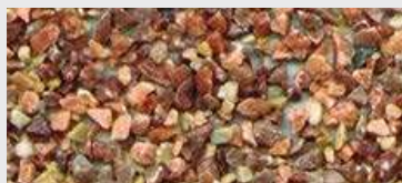
MAR2 M103 HBW 18