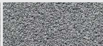
DE ST 08