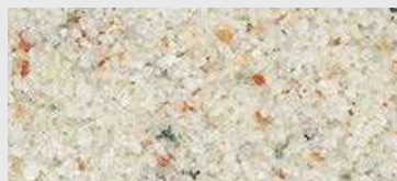
MAR1 M022 HBW 51