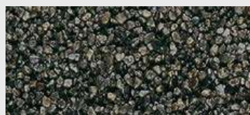
MAR2 M092 HBW 6