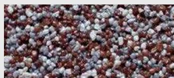
DE SA CGZZ