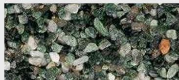
MAR2 M043 HBW 15