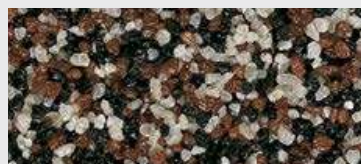
MAR2 0049 HBW 11