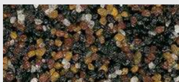
MAR2 0076 HBW 8