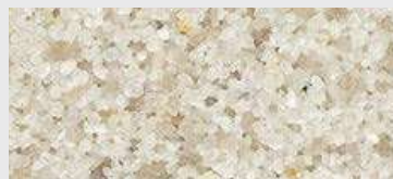
MAR2 0077 HBW 48