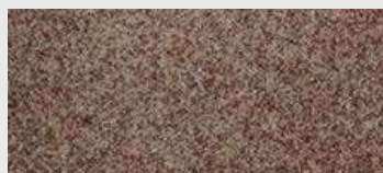
DE ST 05