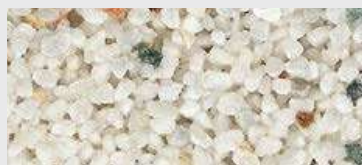
MAR2 M057 HBW 48