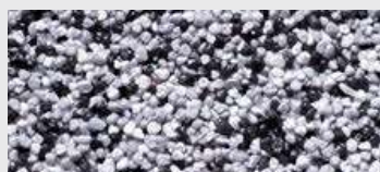
DE SA OKCC