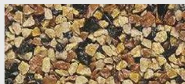
MAR2 M052 HBW 21