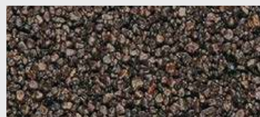
MAR2 M091 HBW 7