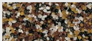
MAR2 0037 HBW 14