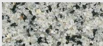
MAR1 0040 HBW 32