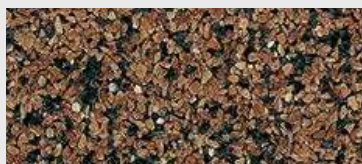
MAR1 0075 HBW 12