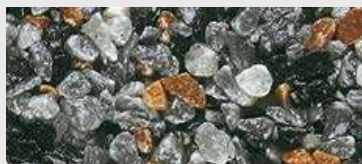
MAR3 M203 HBW 15