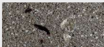
DE ST 06