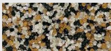
MAR2 0038 HBW 19