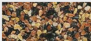
MAR2 M050 HBW 14