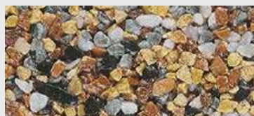
MAR2 M055 HBW 21