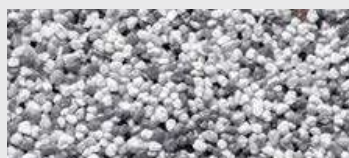
DE SA KKGC