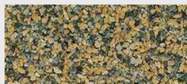
MAR1 M024 HBW 19