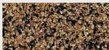
MAR1 M062 HBW 16