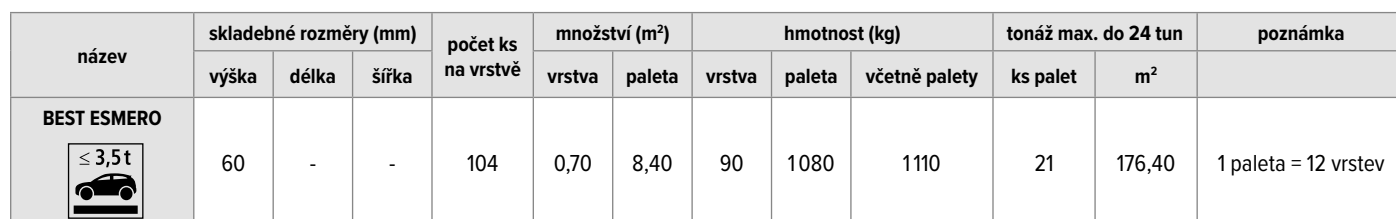
Orientační skladba kamenů na vrstvě

Jsmo držiteli Zlatého certifikátu za kompletní certifikaci dle norem ISO 9001, ISO 14001, ISO 50001, ISO 45001. Naše výrobky jsou vyráběny a kontrolovány podle evropských harmonizovaných norem.